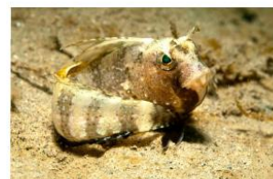
Blennie ocellée