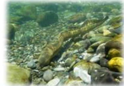
La lamproie marine

« Suivi » de la pêche professionnelle en mer