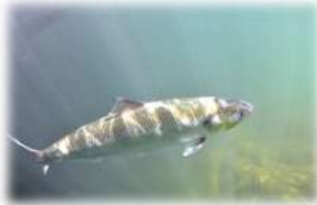
L'alose Feinte du Rhône