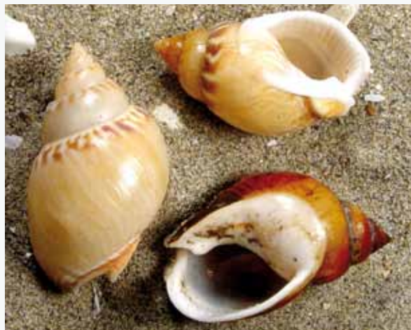
Nasse changeante, une pêche en développement

Par ailleurs, 2 espèces d'intérêt communautaire fréquentent ponctuellement la zone : la tortue caouanne et le grand dauphin. Les tortues marines bénéficient sur la commune du Grau-du-Roi d'un centre de soins pour tortues marines qui intervient suite à des échouages ou captures (CESTMED). Un autre animal emblématique y est observé régulièrement, notamment à proximité des enrochements de la digue de Port Camargue : l'hippocampe à museau court.