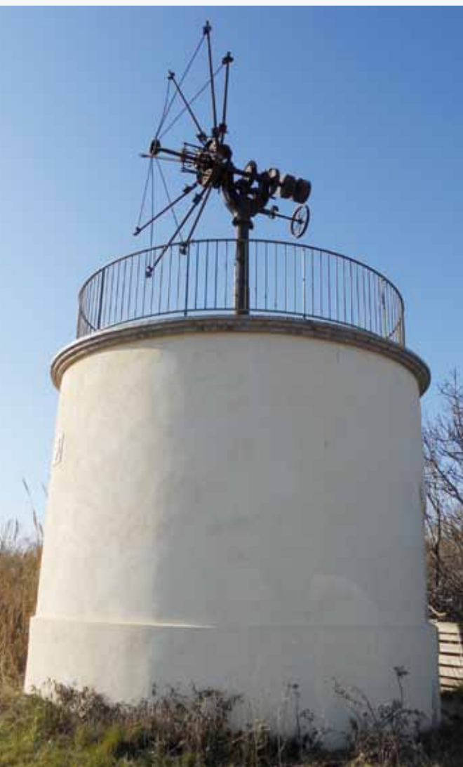
Le moulin de Tourvielle, site aménagé pour l'accueil des chiroptères

> Un film documentaire est actuellement en cours de réalisation, il est prévu pour fin octobre 2013.