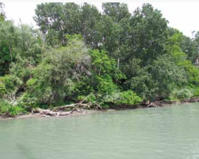
Ripisylve du Rhône

Dix grands objectifs de conservation ont été mis en évidence pour les deux sites : sept objectifs transversaux (qui concernent indirectement les habitats et les espèces) et trois objectifs propres aux espèces et/ou habitats d'intérêt communautaire.