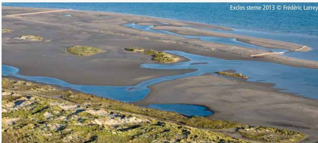
Exclos sterne 2013