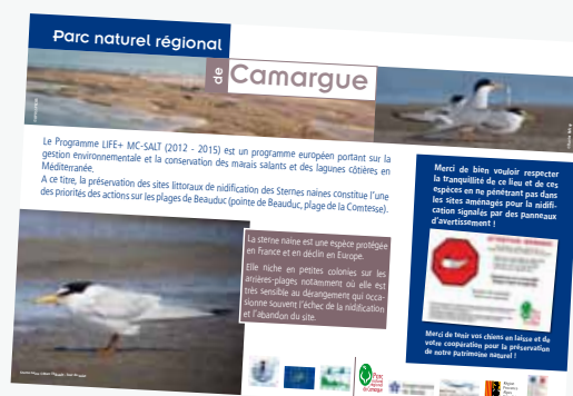
Panneau de sensibilisation sur la nidification des sternes naines sur les plages

Un site internet est dédié à ce programme ( www.mc-salt.eu ) qui rassemble des gestionnaires de sites NATURA 2000 en France (Parc naturel régional de Camargue, Tour du Valat, mais aussi le Groupe Salins sur les salins d'Aigues-Mortes), en Italie et en Bulgarie.