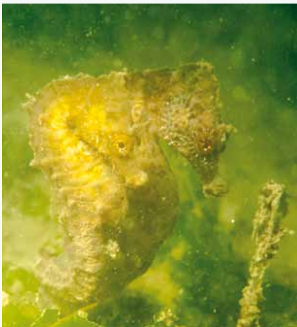
Hippocampe à museau court

Le diagnostic écologique de cette aire marine protégée a été achevé en 2012 pour l'Agence des Aires Marines Protégées et a révélé un bon état écologique des habitats. Lors de cette étude, 179 espèces benthiques ont ainsi été inventoriées parmi lesquelles des espèces d'intérêt commerciales comme la telline, la nasse changeante ou le poulpe. D'ailleurs, la richesse biologique de ces habitats est bien connue des pêcheurs qui y concentrent une partie de leur activité.