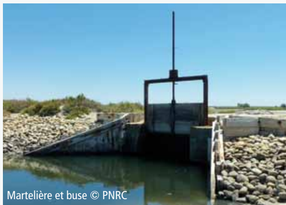
Martelière et buse

En Camargue, sur les étangs et marais des anciens salins de Giraud (propriété du Conservatoire du littoral), les actions portées par le Parc naturel régional de Camargue et la Tour du Valat consistent notamment à réaliser des travaux hydrauliques permettant une alimentation gravitaire en eau de mer des lagunes auparavant alimentées par les pompes des Salins du Midi. La variabilité annuelle et interannuelle des niveaux d'eau constitue l'une des conditions de gestion du site qui se compose d'une grande diversité d'habitats et d'espèces d'intérêt communautaire dont l'unique colonie française de flamants roses sur l'étang du Fangassier.