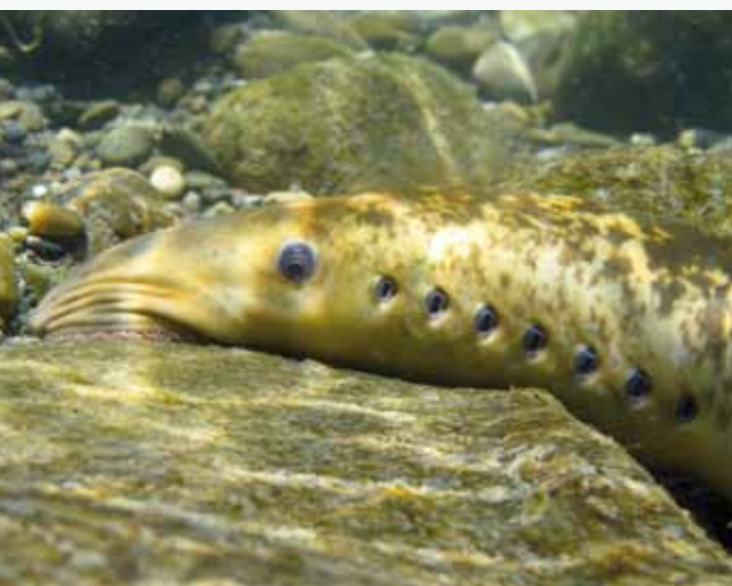
Lamproie marine

Cette démarche a permis également d'homogénéiser les objectifs du site Rhône aval avec ceux du Petit Rhône et permettre ainsi un rapprochement des deux sites pour l'élaboration de leurs documents d'objectifs respectifs. Cette démarche de mutualisation des sites Natura 2000 proposée par les services de l'Etat préfigure l'animation commune des actions NATURA 2000 sur le Rhône à partir de 2014.