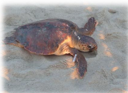
Tortue caouanne ( Caretta caretta )