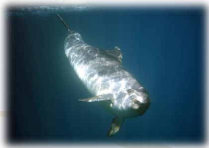
Grand dauphin ( Tursiops truncatus )