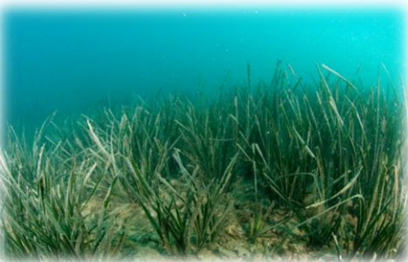
Herbiers de posidonies ( Posidonia oceanica )