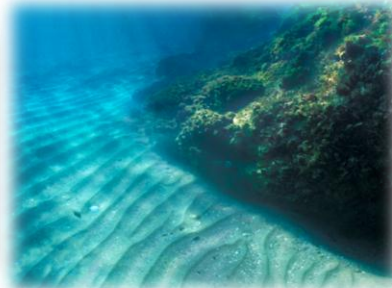
Bancs de sable à faible couverture permanente d'eau marine